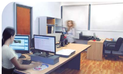
Administración y Mesa de Ayuda del Campus Virtual