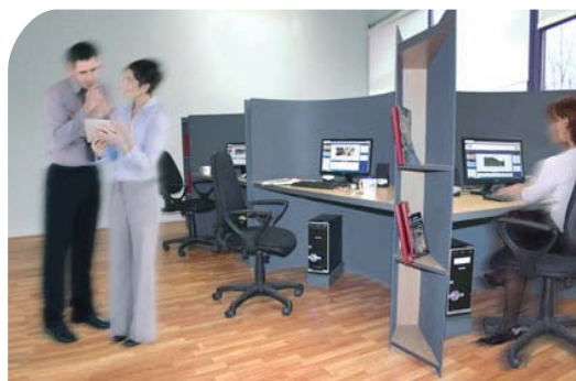
Sala de Ejercicio de las Actividades Tutoriales

Todas las dependencias cuentan con aire acondicionado y calefacción.